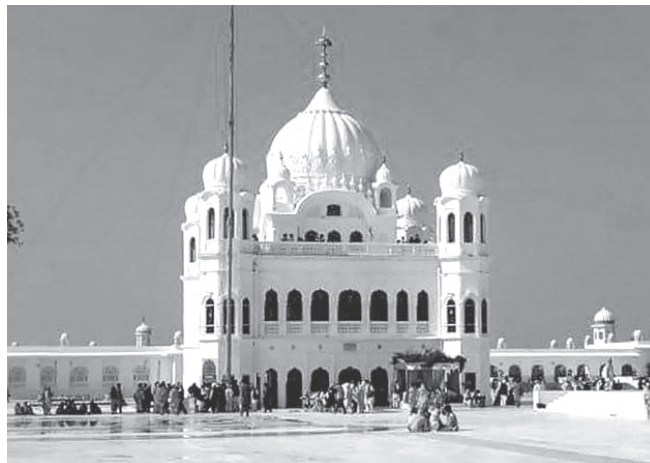
Gurdwara Kartarpur Sahib, Pakistan

It will be pertinent to clarify here that in the Sikh tradition the Guru as a person is neither God nor God’s incarnation. The idea of divine incarnation has been strongly rejected by Guru Nanak who calls himself the ‘lowliest amongst the lowly’ and a shair or balladeer eulogizing the Divine. The Sikh tradition accepts Guru Nanak as also the succeeding Gurus to be perfectly realized souls whom God selected as His instruments to communicate His Word to humankind in general. It is through them that God’s Word enters human history because it is through them that God’s word is revealed. In other words, the Guru is the voice of God, God’s self-revelation. The Guru’s body has been taken as the repository of the Light Divine, a medium for the articulation of the divine Word as it came from God. So the body of the Guru is